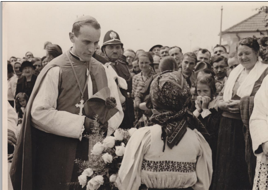
mons. Alojzije Stepinac in visita pastorale