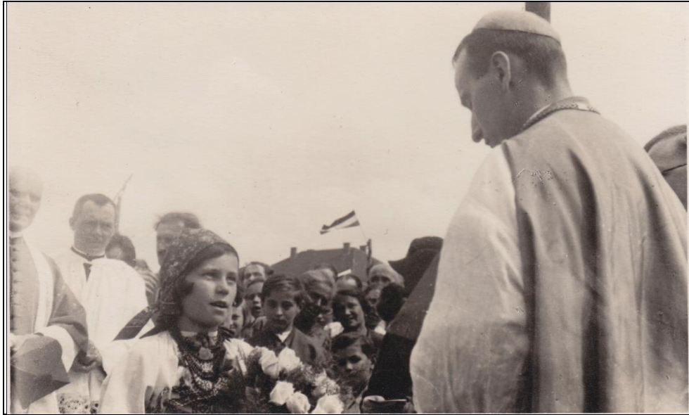
mons. Alojzije Stepinac in visita pastorale