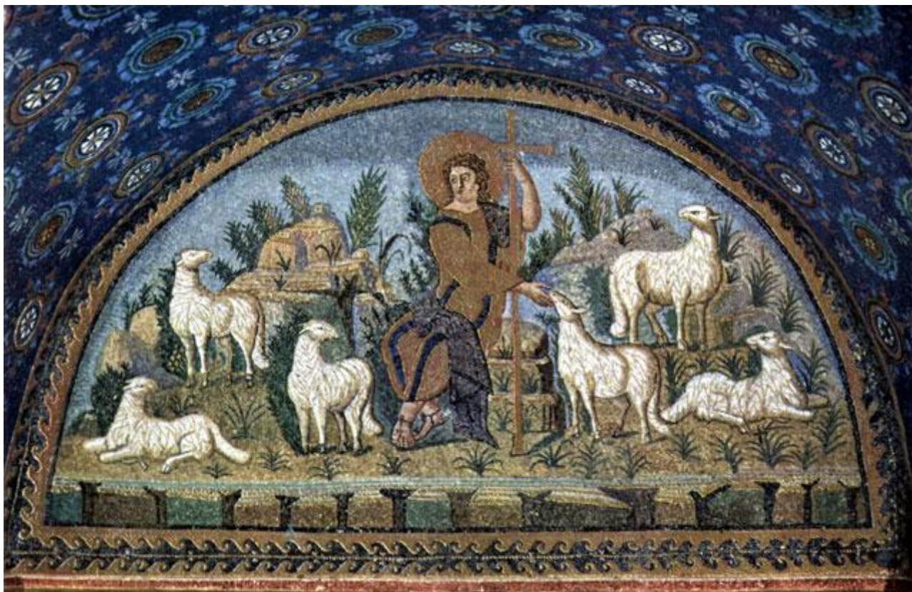
Buon Pastore, mosaico, mausoleo di Galla Placidia, Ravenna.

Seguendoti senza resistenze e senza paure, giungeremo ai prati verdeggianti, alle fresche sorgenti della tua dimora, dove tu ci farai bere e riposare.