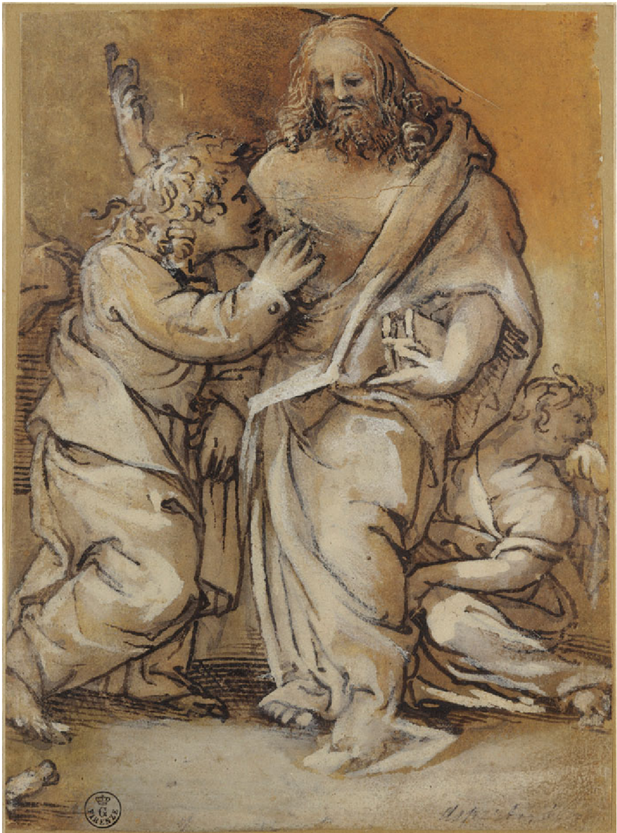
Aspertini Amico (1474-1552), Incredulità di S. Tommaso n. 1453 F. Firenze, Gabinetto dei Disegni e delle Stampe degli Uffizi.